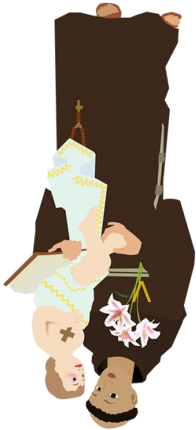
San Antonio Dame un novio