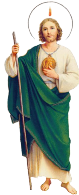
Patrón de las causas imposibles