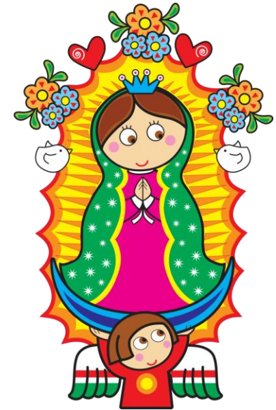
Virgencita plis dame mucha fuerza para poder levantarme temprano